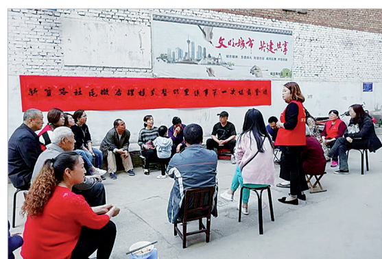
新宝路社区举行居民议事协商会