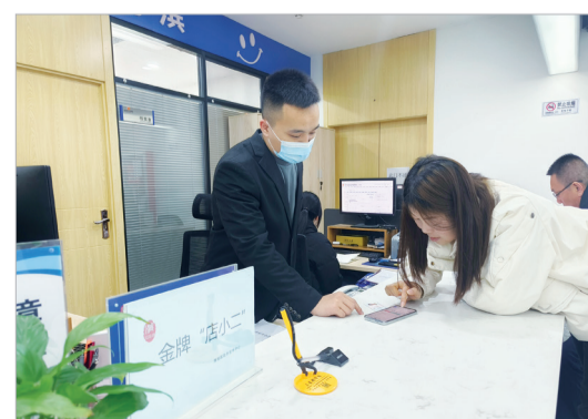
工作人员指导群众用手机办事