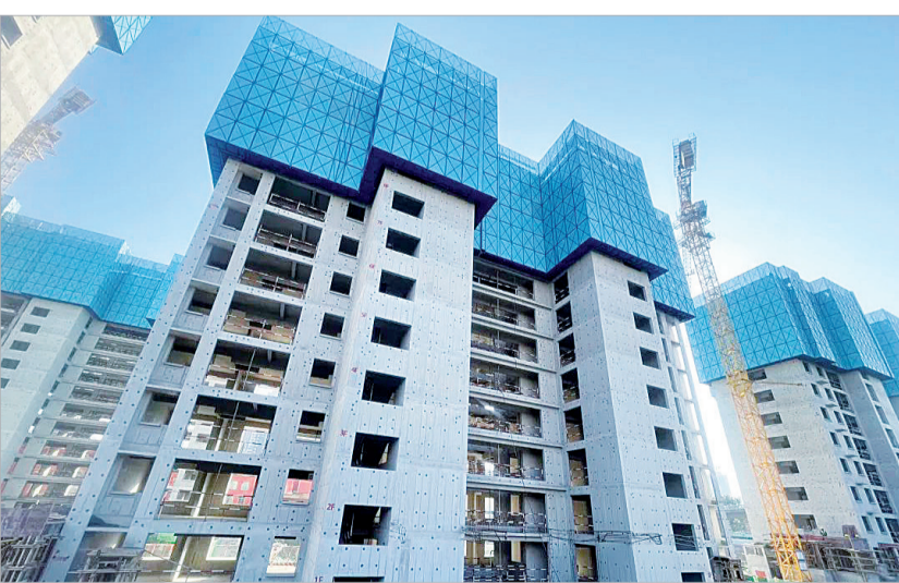
正在建设的南关路城市综合体安置楼