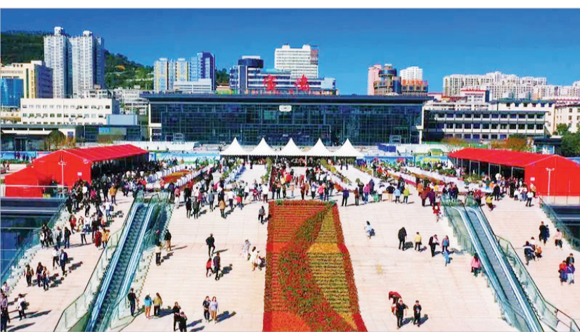
改造后的宝鸡火车站广场