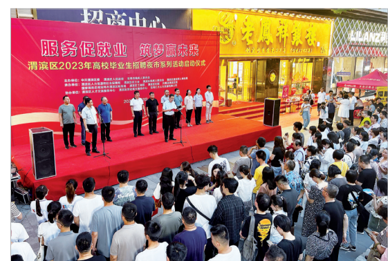
高校毕业生招聘夜市系列活动启动仪式(资料图)