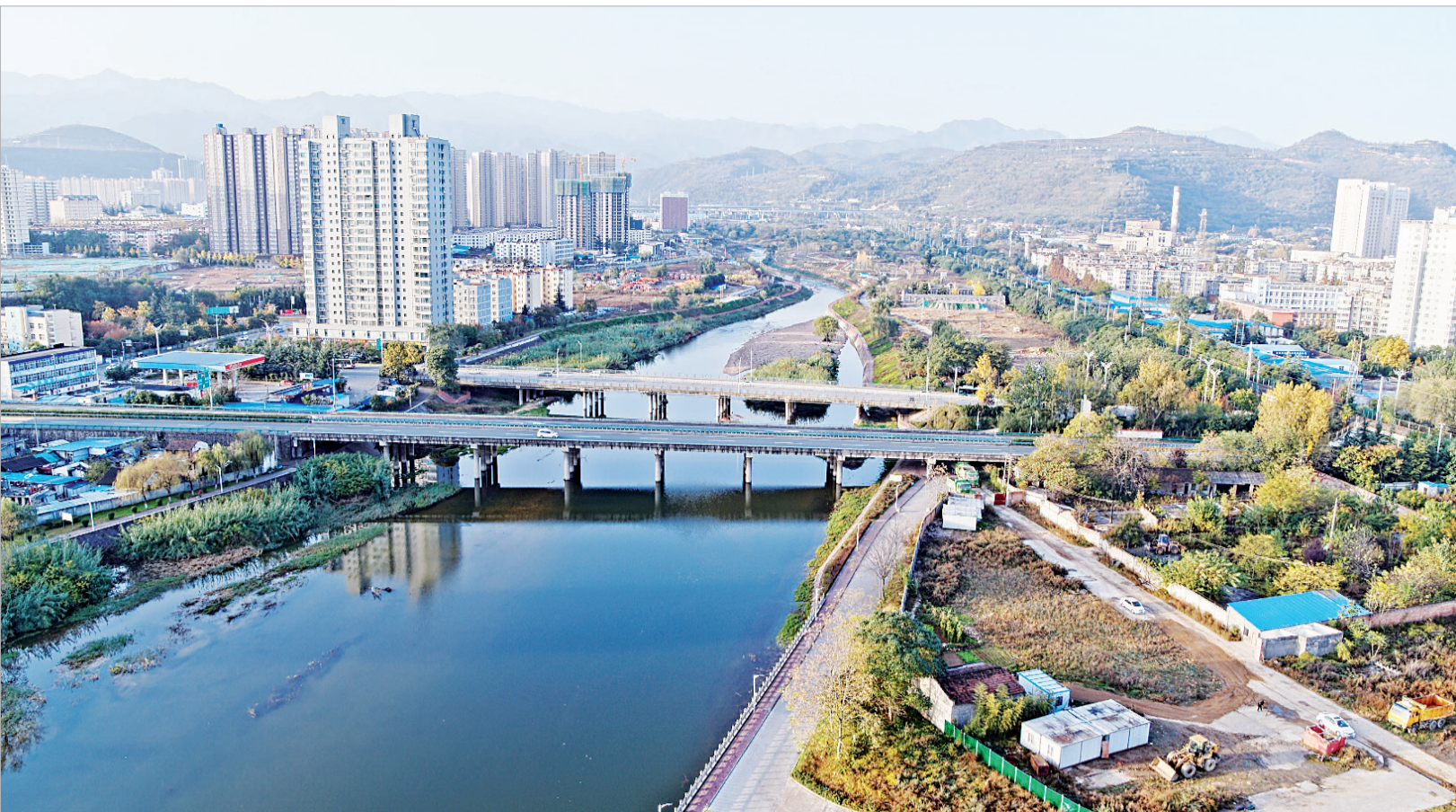
全国“最美家乡河”——清姜河