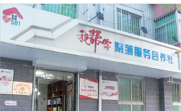
“我帮你”院落服务合作社