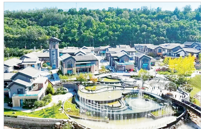
全国“乡村治理示范村”——茵香河村