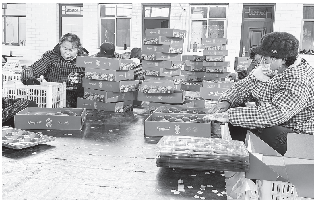
保安堡村村民在家门口打工

“今年我们又争取了‘圆桶养鱼’项目，项目还没建好，省内外多家企业就已经跟我们对接了，预计投用后