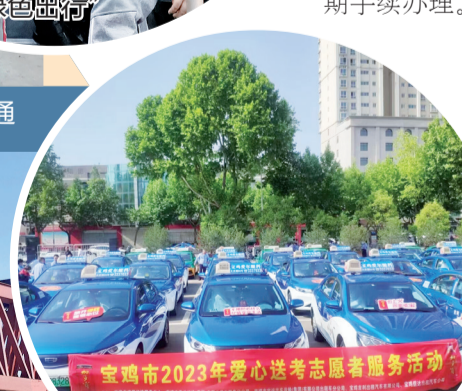
宝鸡市2023年爱心送考志愿者服务活动