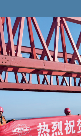
眉太高速公路渭河特大桥梁板架设完成