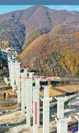
建设中的马耳山特大桥