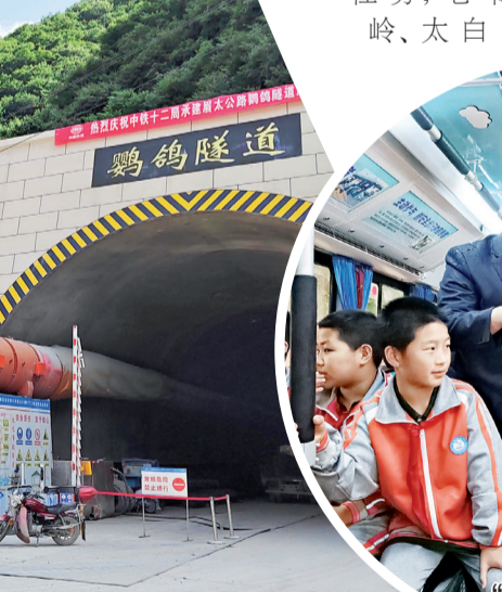
小学生体验“绿色出行”