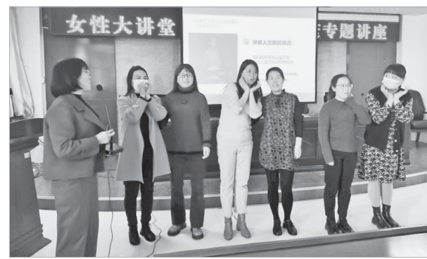
女性心理健康讲座进企业