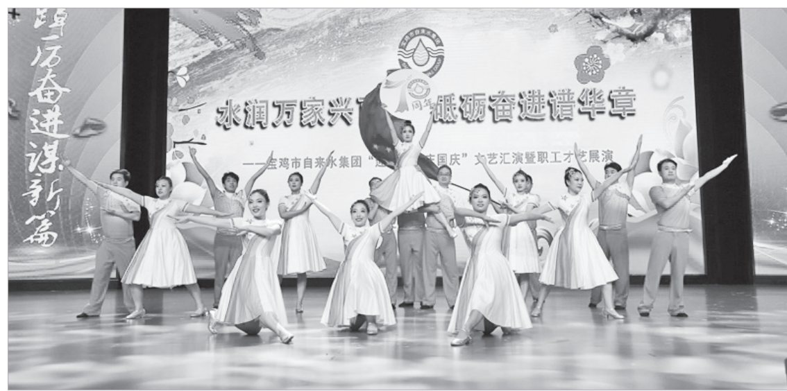
工会搭舞台,女工展风采。

省实施女职工劳动保护特别规定》等法律法规及女职工劳动安全卫生知识。2023年,市总工会邀请资深律师走进宝鸡人民广播电台《法律纵横》栏目,开展“以案释法”宣传活动,就《劳动法》《劳动合同法》等法律法规进行案例解析,通