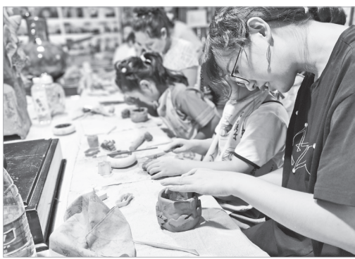
公益课丰富女工业余生活(资料照片)