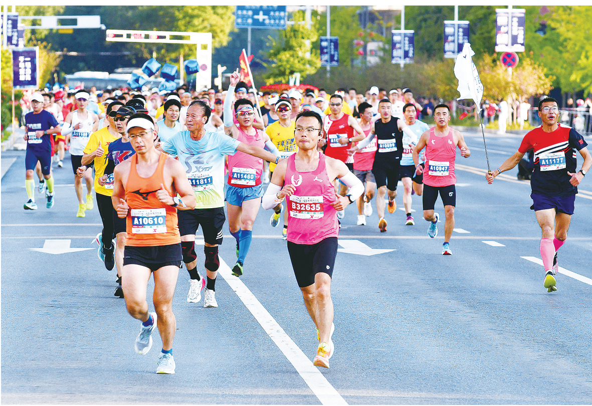
2023 宝鸡马拉松赛吸引了全国各地的跑友