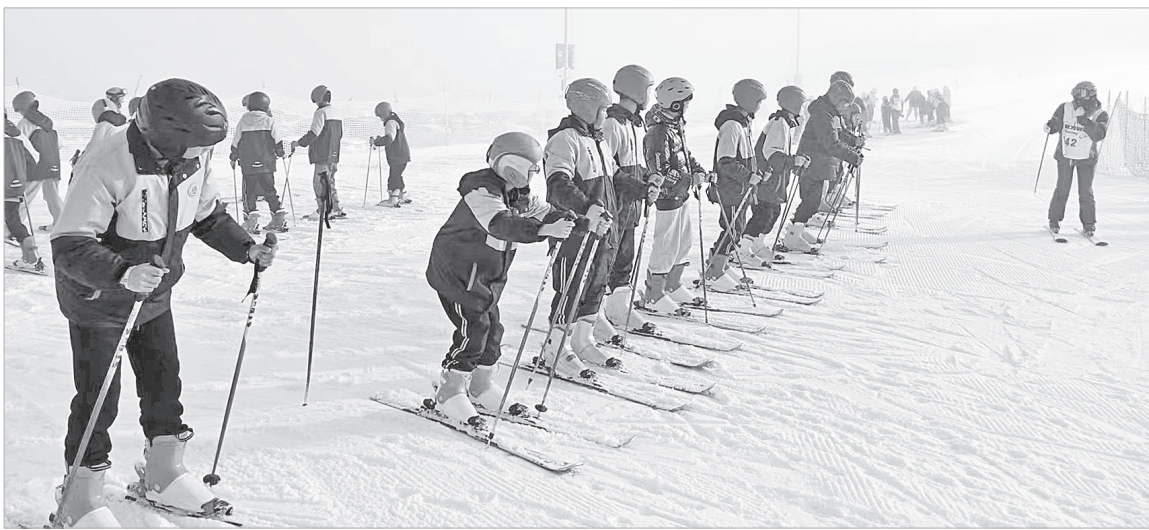
太白县咀头镇初级中学开展冰雪研学实践教育活动