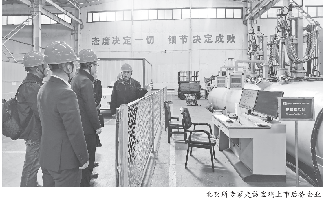
北交所专家走访宝鸡上市后备企业

于2019年启动了上市筹备工作,2022年6月,企业入选工信部专精特新“小巨人”企业,2023年7月,进入陕西省上市企业后备库。目前,企业正在抓紧做内控提升工作,并与券商签了协议,券商已经开始做基础调研了。宝鸡市永