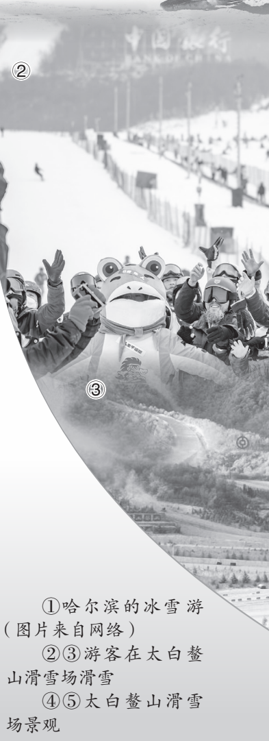
① 哈尔滨的冰雪游 (图片来自网络) ②③ 游客在太白鳌山滑雪场滑雪 ④⑤ 太白鳌山滑雪场景观