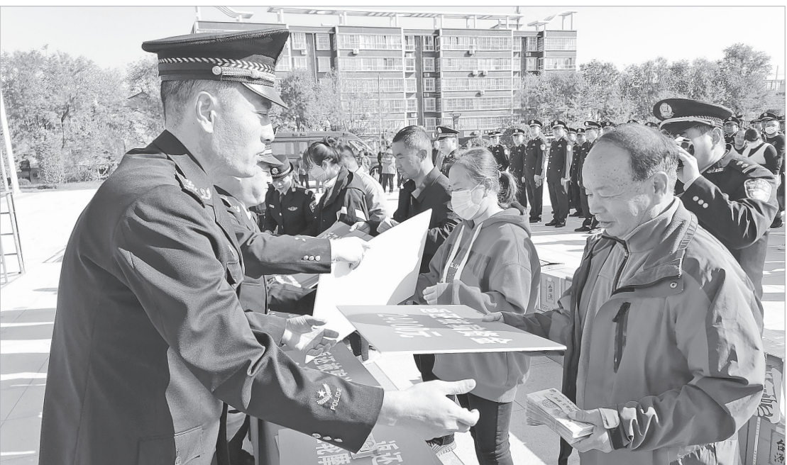
眉县公安局向群众返还被盗被骗财物

化试点合格城市”,市委政法委、市公安局等5个单位和15个人被省委、省政府表彰为“中国—中亚峰会”服务保障工作先进集体和先进个人。