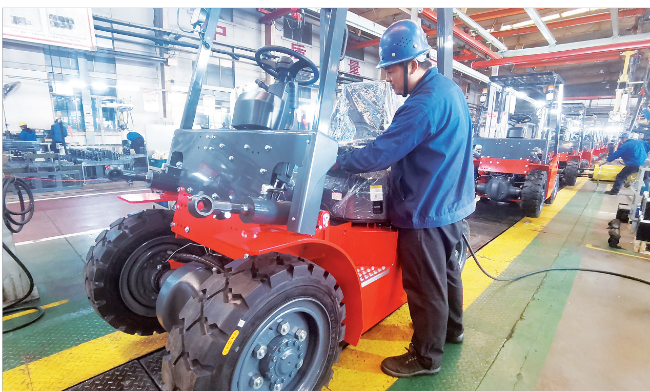
工作人员在组装新能源叉车

本报讯(记者 罗锐)紧盯用户需求、积极研发新品,销量持续走高,宝鸡合力叉车有限公司在新能源叉车市场高歌猛进。12月7日,记者从该公司了解到,今年1至11月,新能源叉车销量达2700余台,同比增长128%,实现营业收入近2亿元。