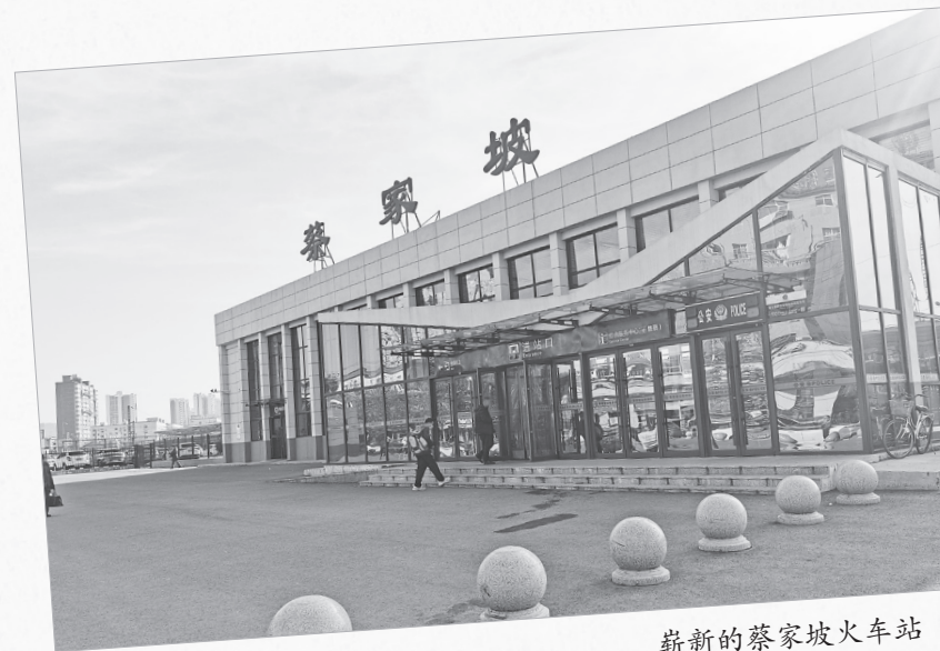
崭新的蔡家坡火车站