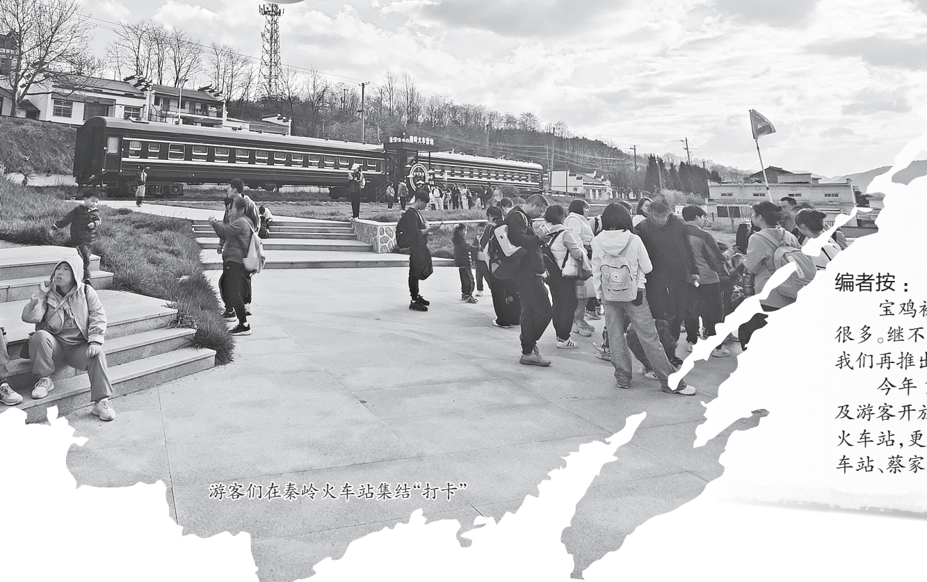
游客们在秦岭火车站集结“打卡”