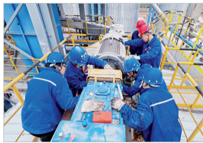
进企纾困让项目动起来

营商环境是企业生存发展的“土壤”，也是推动经济社会高质量发展的硬支撑。今年以来，麟游县以开展“三个年”活动为抓手，将优化营商环境作为高质量发展的“加速器”，想方设法为群众简化办事流程，真心实意为企业纾困解难，引来一批好项目相继落户，为全县高质量发展增添新动能。