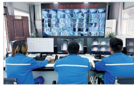
林麝养殖搭上数字化快车