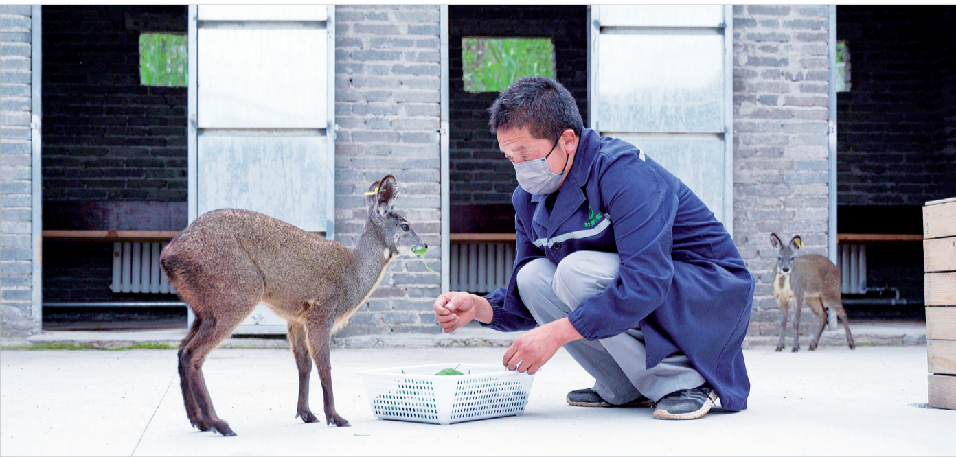
饲养员在喂养林麝

麟游县以软环境之“优”谋发展之“快”，用实干营造“用心、贴心、暖心、舒心”的营商环境，用实绩换取群众及企业的“幸福指数”，以营商环境之“优”，促经济之“稳”、发展之“进”！