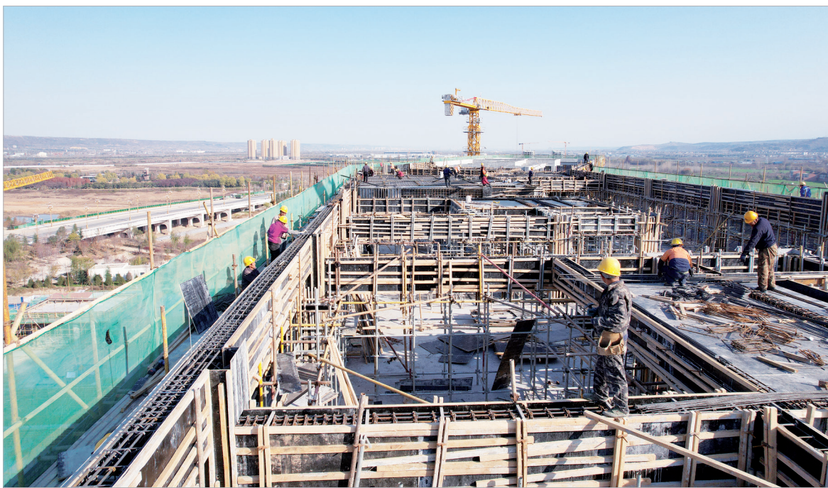
市妇幼保健院高新院区项目建设现场