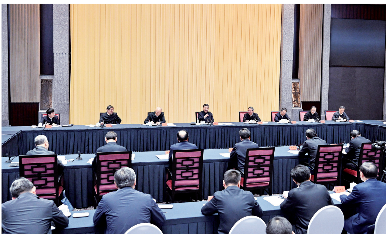
11月30日上午，中共中央总书记、国家主席、中央军委主席习近平在上海主持召开深入推进长三角一体化发展座谈会并发表重要讲话。

新华社上海11月30日电 中共中央总书记、国家主席、中央军委主席习近平30日上午在上海主持召开深入推进长三角一体化发展座谈会并发表重要讲话。他强调，深入推进长三角一体化发展，进一步提升创新能力、产业竞争力、发展能级，率先形成更高层次改革开放新格局，对于我国构建新发展格局、推动高质量发展，以中国式现代化全面推进强国建设、民族复兴伟业，意义重大。要完整、准确、全面贯彻新发展理念，紧扣