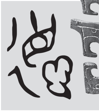
何尊铭文中的“德”字

为：直视前方，遵循本性，必然有得。甲骨文里，“得”字一般用在记录通过战争获取了多少财富和俘虏。而在何尊铭文“恭德裕天”中，“德”字的右下角多了一个“心”，象征着民心、民意、民本，从而与“得”字区别开来。这标志着“德政”理念体现在了文字上，而“德政”的提出，也奠定了中国文化向人本主义和理性主义发展的大方向。实行德政，统治者必须强化自身修养