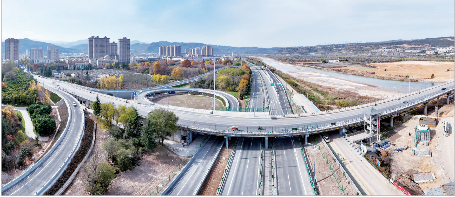
已开通试运行的福谭立交桥

计可实现出口创汇8000多万元。借力“一带一路”，今年我市全力推进国际货运班列开行。宝鸡港务区联合西安国际港务区、宝鸡综合保税区，组建宝鸡港口贸易运营有限责任公司，负责组织货源、运营线路、贸易流通，高质量运营宝鸡国际班列。目前每月从宝鸡常态化开行3列中欧班列，有效降低了企业外贸经营成本，为企业承揽外贸订单创造了条件。10月份，我市发运中亚班列5列250个集装箱，货物以布料、电梯、空调器为主，货物总重量4797.44吨，总货值1483.68万美元。