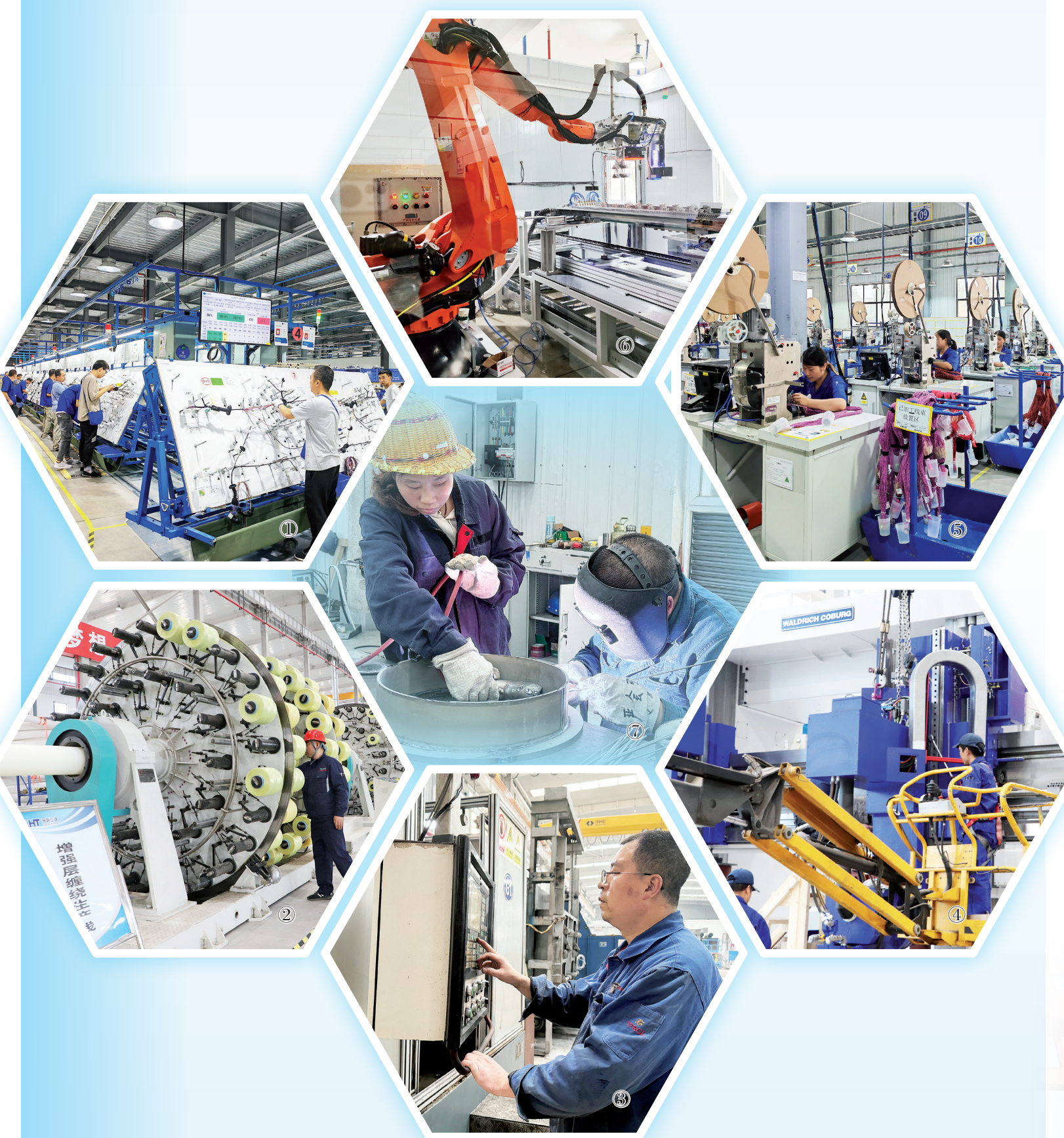
图说：①⑤比亚迪宝鸡线束工厂 ②宝鸡高新区RTP柔性复合高压输送管项目 ③宝鸡天锋热处理股份有限公司工人在调试设备 ④渭滨区高端智能齿轮装备研制与产业化项目 ⑥奇点能源5GWh储能设备生产线项目 ⑦宝鸡新元达设备制造有限公司工人在进行氩弧焊作业

比亚迪是全球领先的新能源汽车及动力电池供应商，为何这次选择“牵手”宝鸡？汽车产业是我市成长最快、最具发展潜力的优势产业，也是我市全力打造的全年经济社会发展目标任务，将“施工图”变成“实景图”，奋力谱写宝鸡高质量发展新篇章！