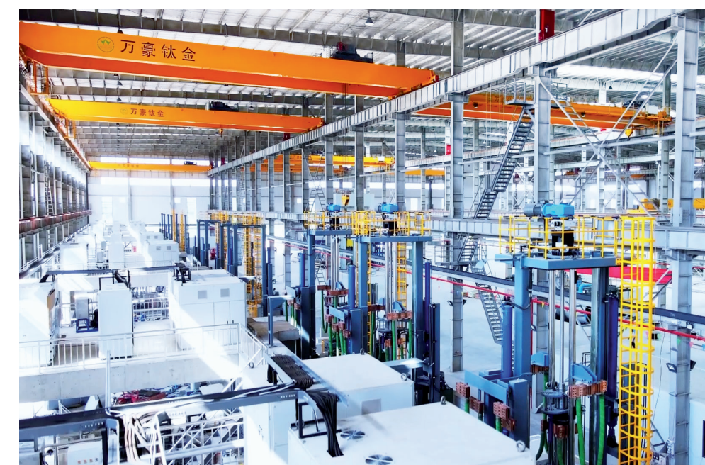
万全国际先进钛及钛合金材料制造产业园项目

的问题下发红色督办单，对连续3次下发督办单后仍未落实的有关部门、单位主要负责人进行督查约谈，进而推动重点项目有序进行。