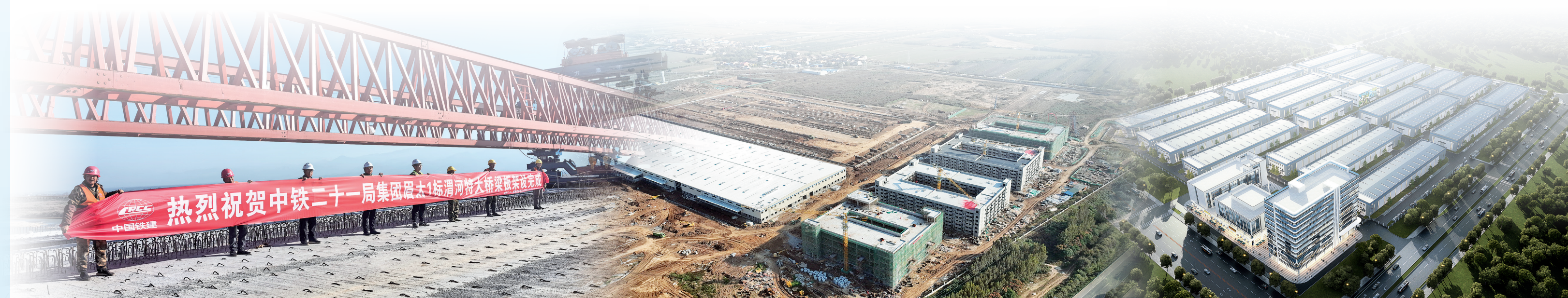
眉太高速公路项目