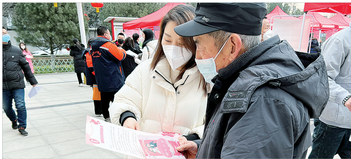
金台区开展婚俗文化宣传

本报讯(康健)11月7日，笔者从市农业农村局获悉，农业农村部门近日推介第四批“文明乡风建设”典型案例，我市金台区“培育文明向上婚俗文化”入选县级案例。