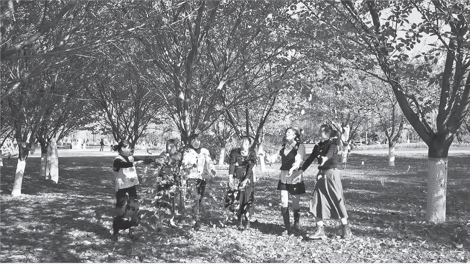
市民在渭河生态公园东岭廊桥东侧观赏点游玩

本报讯（王菁）“落叶缓扫”，留住秋意美景。11月8日，笔者从相关部门了解到，我市今年继续实行此模式，在去年基础上，市区新增5处观赏点，方便市民群众驻足赏落叶、拍秋景。