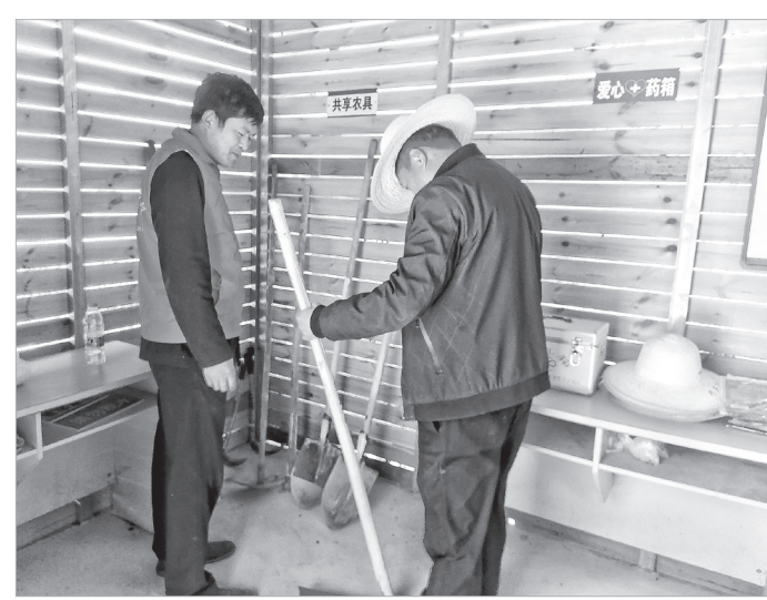
村民在驿站取用农具

本报讯（董璐）11月7日，笔者在陈仓区拓石镇通洞村看到，村上新建了一个助农服务驿站，为广大村民打造了一个休憩的好去处，村民还可以共享这里的农具。