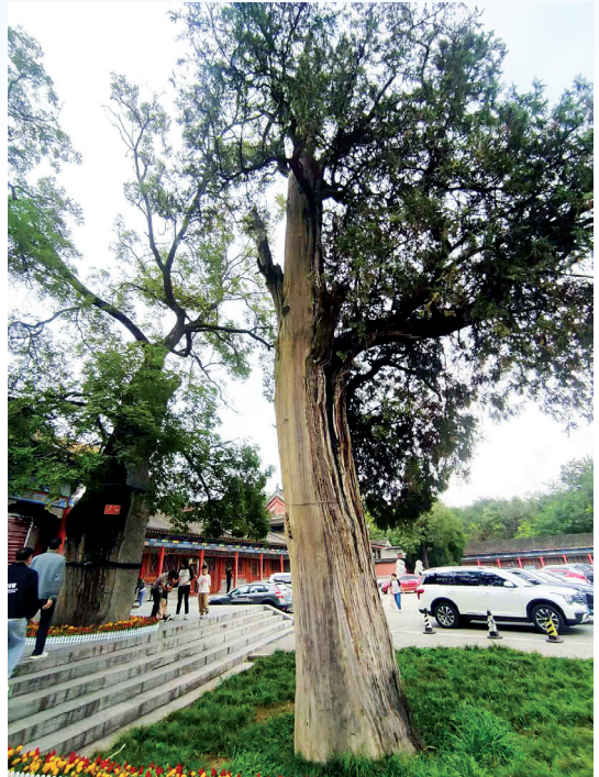
②岐山县周公庙门前1300岁侧柏

在眉县横渠镇的张载祠内，有一棵张载亲手栽植的桧柏，这棵树高9.3米，树围3.6米，近1000岁，被原林业