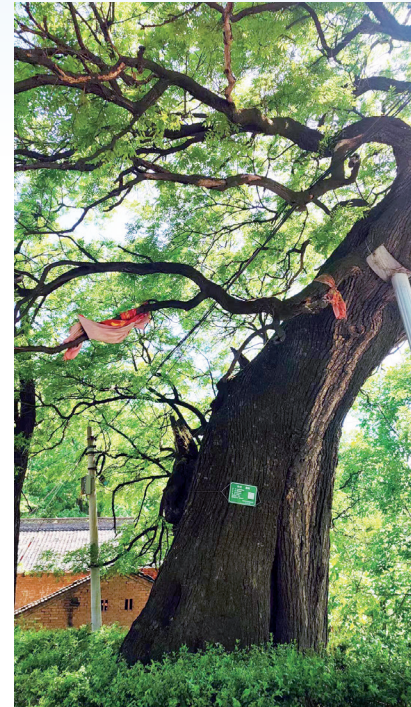
④渭滨区高家镇槐树岭村800岁古槐

部命名为中华名树。细看此树，纹理盘若蛟龙，遒劲向天，两根树干，一根枝叶葱茂，一根秃如铁掌。据历史记载，明朝嘉靖三十四年腊月，关中大地震，此树严重受损，虽如此，但它依然顽强生长。到现在，这棵树历经沧桑，依然傲立天地间，充满生机。