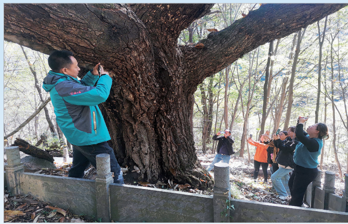
①10月22日，本报编辑记者在陈仓区坪头镇安平沟拍摄古橡树。

在寻访、拍摄古树的过程中，我们更深刻地感受到古树难以替代的价值、保护古树的巨大意义，更为宝鸡拥有这么多古树、众多古树被悉心保护而自豪。今天，让我们回眸这100期报道，去更全面地领略宝鸡古树的风采吧！