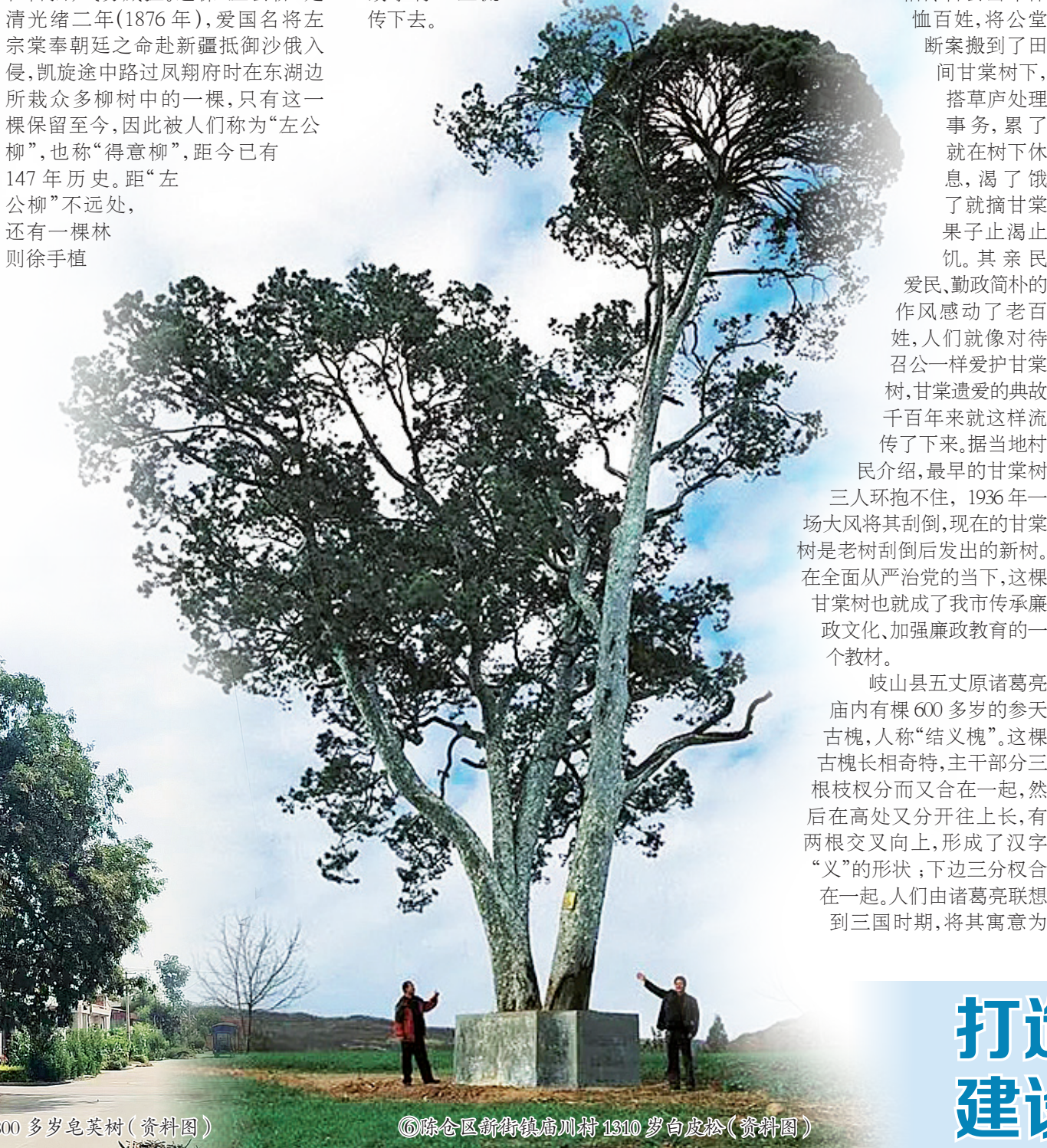
⑥陈仓区新街镇庙川村1310岁白皮松(资料图)