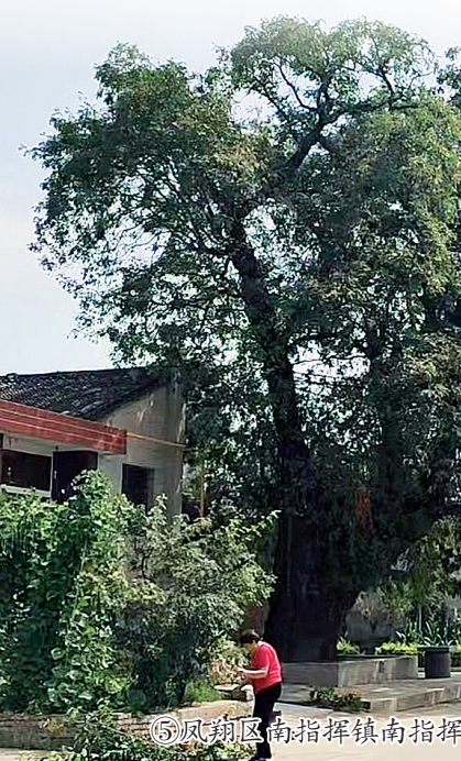
⑤凤翔区南指挥镇南指挥村800多岁皂荚树(资料图)