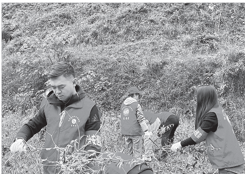
“红小凤”志愿者帮农户采收大豆

林麝养殖是凤县富民增收的特色产业，“红小凤”文明实践志愿服务队通过组织培训班、上门手把