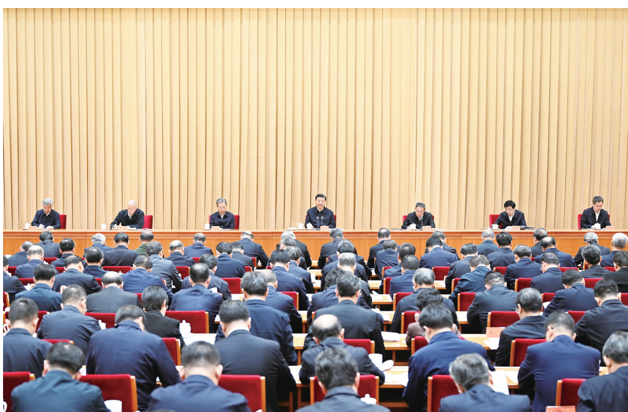
10月30日至31日，中央金融工作会议在北京举行。中共中央总书记、国家主席、中央军委主席习近平出席会议并发表重要讲话。