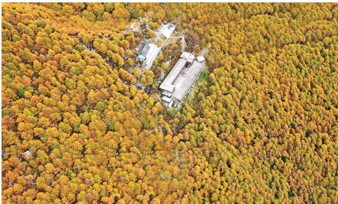
层林尽染