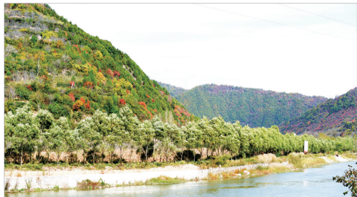
嘉陵江秋色