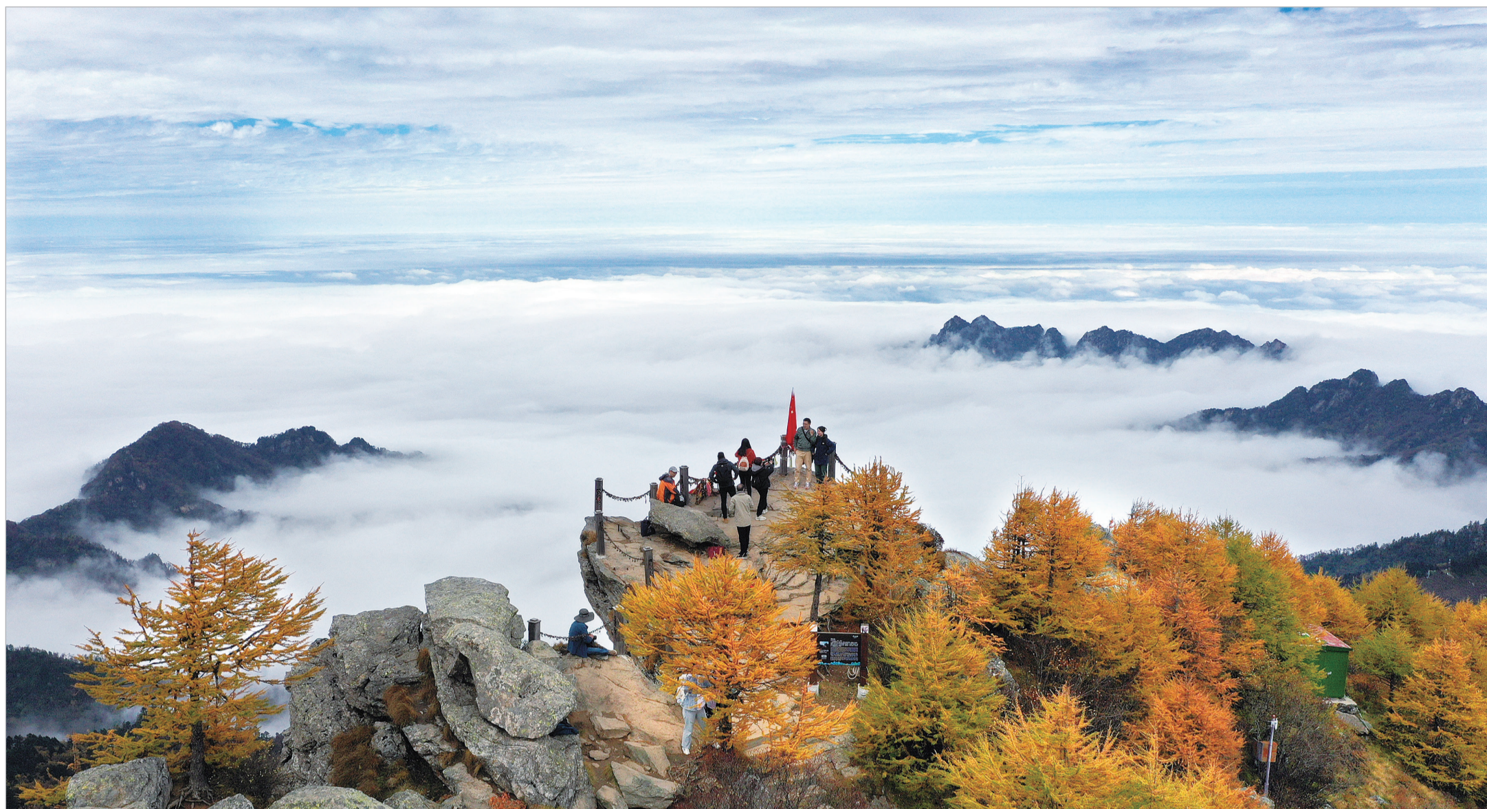
秋游太白山