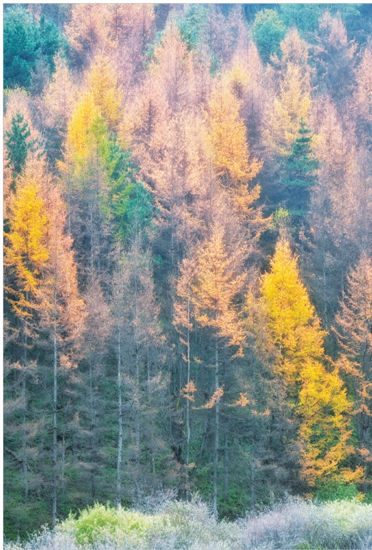
多彩秋景