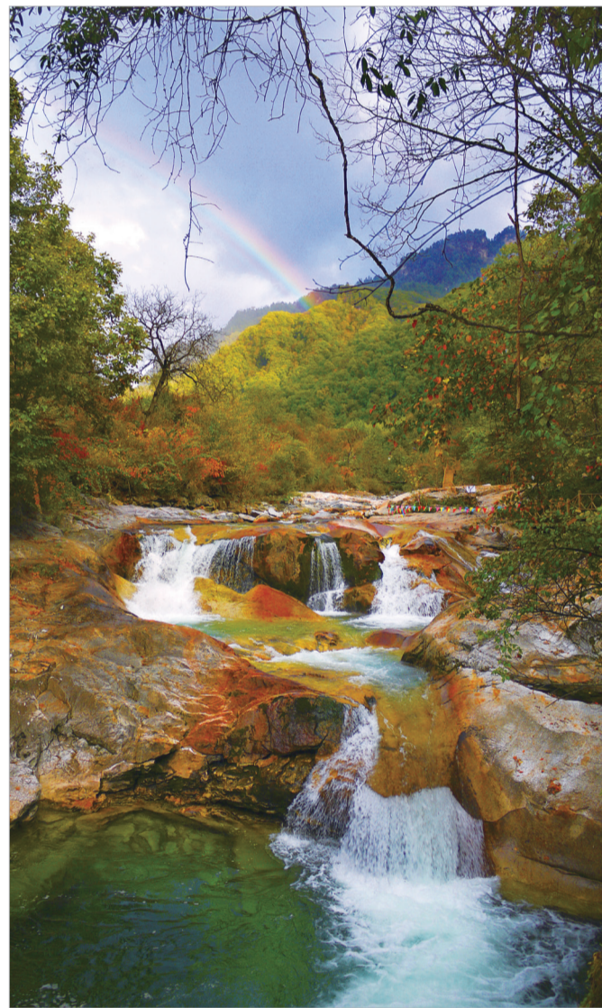
黄柏塬景区叠瀑飞虹