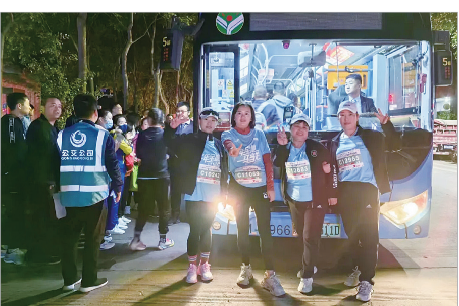
选手乘坐接驳车去参赛

在整个马拉松比赛期间，市公交公司全体人员以高度的责任感和荣誉感为参赛选手提供优质热情周到的服