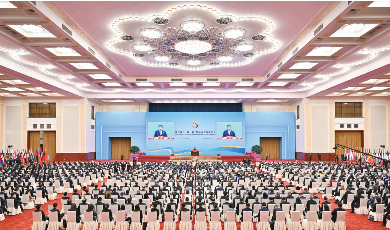
10月18日上午，国家主席习近平在北京人民大会堂出席第三届“一带一路”国际合作高峰论坛开幕式并发表题为《建设开放包容、互联互通、共同发展的世界》的主旨演讲。

新华社北京10月18日电 10月18日上午，国家主席习近平在人民大会堂出席第三届“一带一路”国际合作高峰论坛开幕式并发表题为《建设开放包容、互联互通、共同发展的世界》的主旨演讲。习近平宣布中国支持高质量共建“一带一路”的八项行动，强调中方愿同各方深化“一带一路”合作伙伴关系，推动共建“一带一路”进入高质量发展的新阶段，为实现世界各国的现代化作出不懈努力。 金秋时节，天高气爽，风清日朗。天安门广场上，共建“一带一路”国家国旗迎风飘扬，相映成辉。 出席高峰论坛的外国国家元首、政府首脑和国际组织负责人等国际贵宾陆续抵达。人民大会堂东门大厅两侧大屏幕上，共建“一带一路”项目鎏金十年硕果累累。 习近平同出席开幕式的外方领导人集体合影。 在《和平—命运共同体》乐曲中，习近平同外方领导人一同步入会场。全场起立热烈欢迎。 习近平主席发表题为《建设开放