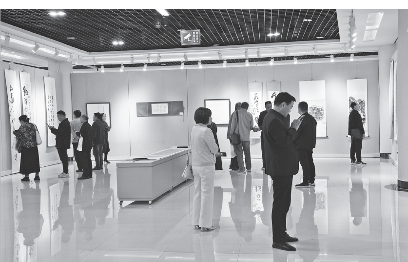
市民参观书法艺术展