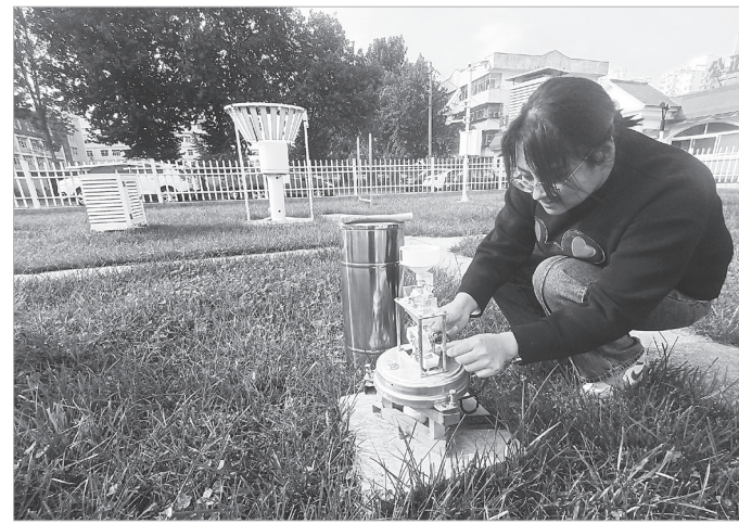
工作人员调试气象设备

本报讯(记者 马庆昆) 2023宝鸡马拉松赛比赛当日天气情况如何?10月9日,记者在市气象局采访时了解到,比赛当日天气晴好,比赛期间气象服务保障工作准备就绪。