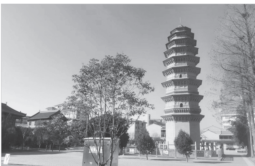
始建于北宋元祐三年(1088年)的岐山太平寺塔如今成为县城地标性建筑

伴随着改革开放的深入发展，特别是党的十八大以来，岐山县城所在地凤鸣镇更是发生了翻天覆地的变化，县城建设规模迅速扩大。通过实施太平塔文化街区、凤鸣湖生态湿地公园改造工程，城市特色风貌更加凸显。新建市民广场、礼乐广场、大剧院广场、交通广场、“凤鸣朝阳”游园等公共开放广场，群众生活休