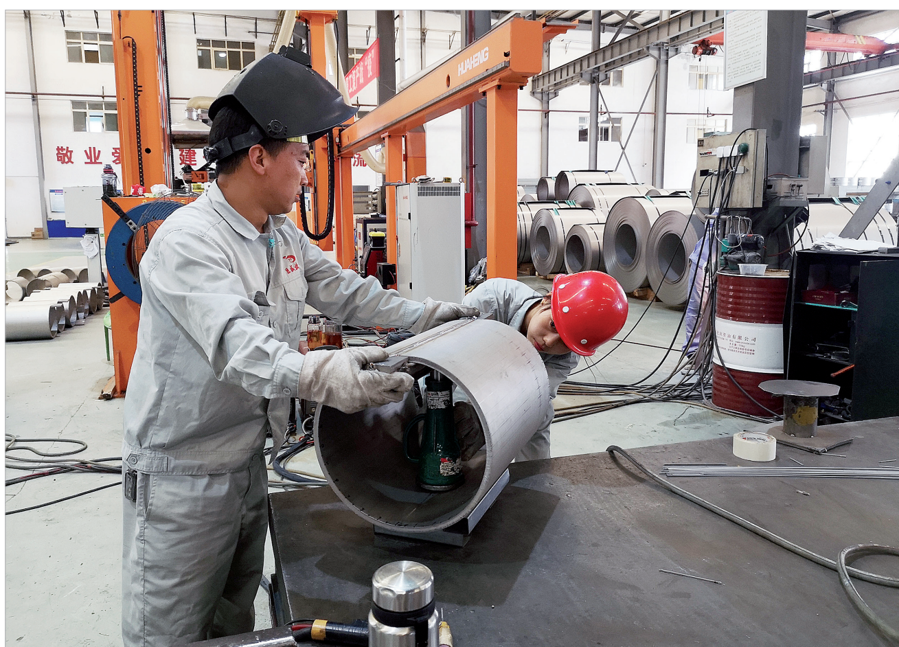
宝鸡巨成钛业股份有限公司工人正在对钛管进行校圆

国企混改，整合优势资源，扩大企业规模。宝钛精密锻造有限公司就是由宝钛集团旗下上市公司宝钛股份和民营企业共同出资成立的。宝钛精密作为我市第一家混改企业，仅7月就完成锻造加工量2384吨，实现加工产值1942万元，创历史新高。