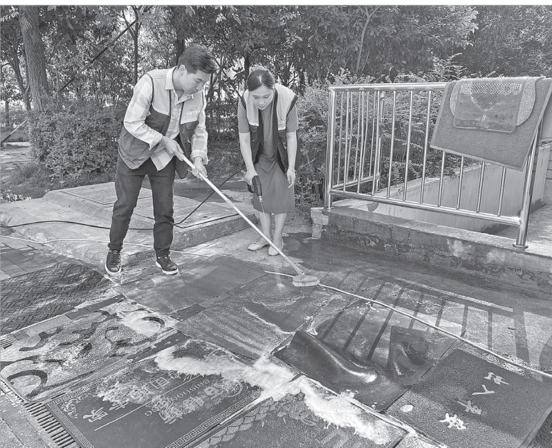
志愿者给辖区居民清洗地垫