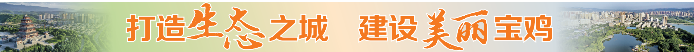
美丽的渭河流经宝鸡市区