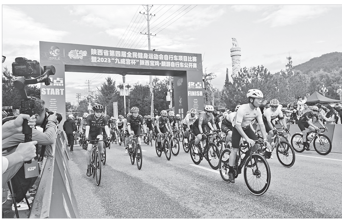
24club和西安博跃单车&陕西乐行分获亚军和季军。在山地组,陕西美利达SFC联合俱乐部夺冠,陕西喜德盛乐行车队2队和陕西喜德盛乐行车队1队分获亚军和季军。

本报讯 8月27日,陕西省第四届全民健身运动会自行车项目比赛暨2023“九成宫杯”陕西宝鸡·麟游自行车公开赛在麟游举行(见右图)。来自全国各地的300名运动员在骑行中感受千年离宫的魅力,在青山绿水间上演速度与激情。 本届赛事以“群众的盛会健身的舞台”为主题,设置公路自行车团体赛和山地自行车团体赛两个组别,其中公路自行车团体赛全程46.5公里,山地自行车团体赛全程31公里。两个组别的比赛线路均以青莲山公园为起点,经过西海苑、南坊新城、杜水河大桥等地,沿途自然环境优美。当天,参赛选手飞驰其间,展示出自行车运动的独特魅力。 经过激烈角逐,贵州龙头马酒业车队夺得公路组冠军,24club和西安博跃单车&陕西乐行分获亚军和季军。在山地组,陕西美利达SFC联合俱乐部夺冠,陕西喜德盛乐行车队2队和陕西喜德盛乐行车队1队分获亚军和季军。