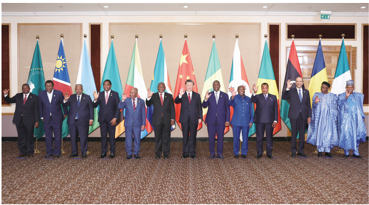
当地时间8月24日晚，国家主席习近平和南非总统拉马福萨在约翰内斯堡共同主持中非领导人对话会。非盟轮值主席、科摩罗总统阿扎利，中非合作论坛非方共同主席国、塞内加尔总统萨勒，非洲次区域组织代表赞比亚总统希奇莱马、布隆迪总统恩达伊施米耶、吉布提总统盖莱、刚果(布)总统萨苏、纳米比亚总统根哥布、乍得总理凯布扎博、利比亚总统委员会副主席库尼、尼日利亚副总统谢蒂马，以及非盟委员会代表穆昌加等出席。这是会前集体合影。