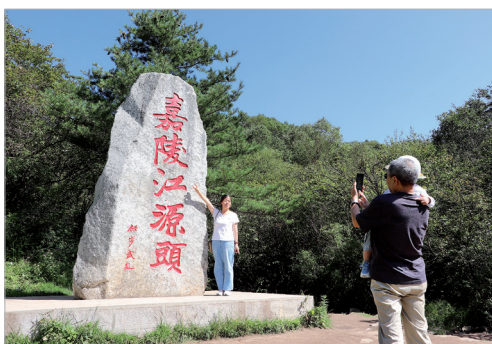
游客在嘉陵江源头打卡

初秋时节，秦岭处处风光旖旎，美如画卷。随着光影变幻，大美秦岭的斑斓秋色尽收眼底，流云奔涌，群山浮动，气势磅礴，观者仿佛置身仙境，无不惊叹自然的瑰丽神奇。