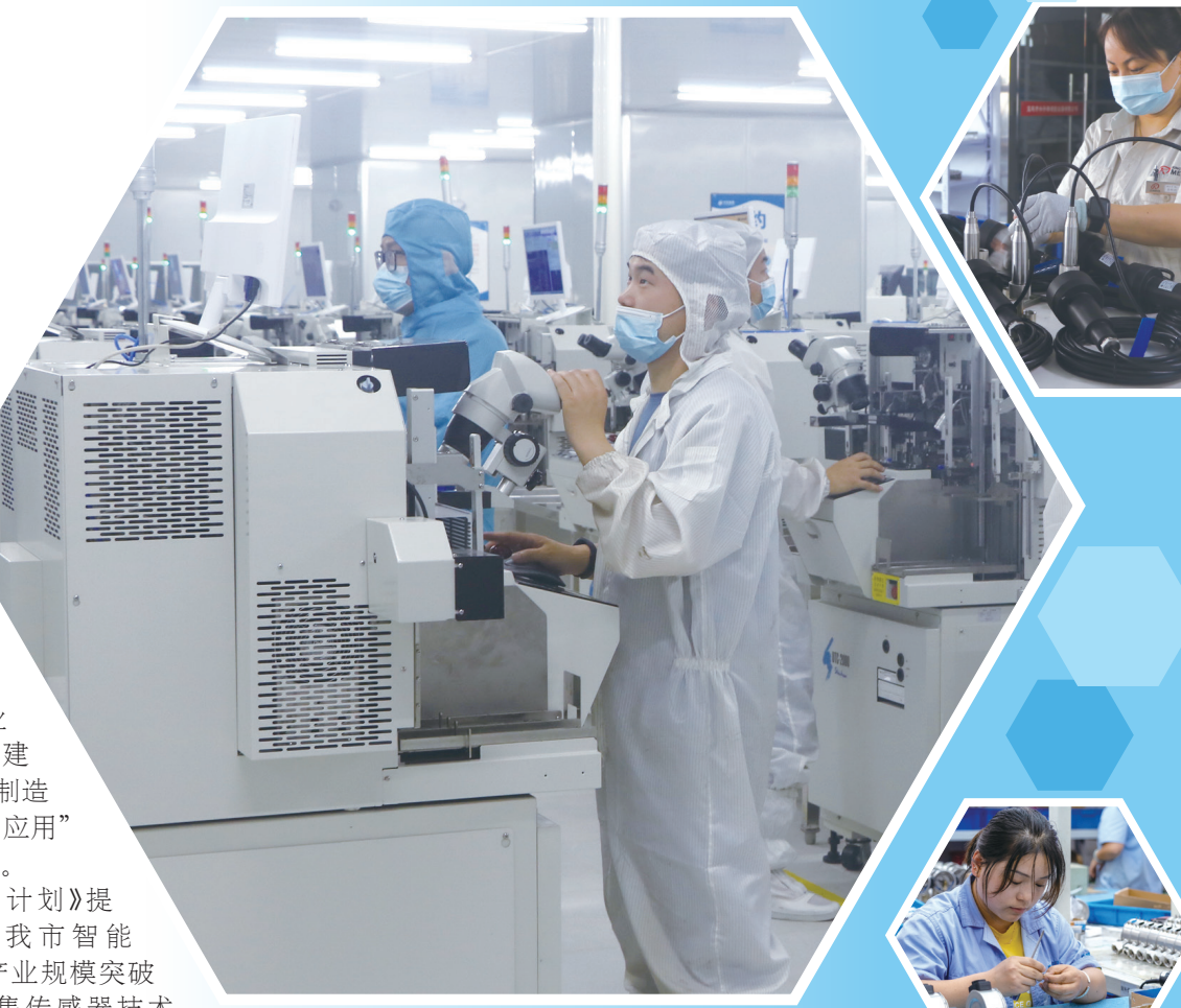
中芯富晟电子科技有限公司 工作人员在操纵设备

“忽如一夜春风来，千树万树梨花开。”相信随着2023智能传感器产业发展大会的召开，我市传感器产业必将迎着发展的春风，开出更加瑰丽的花朵。