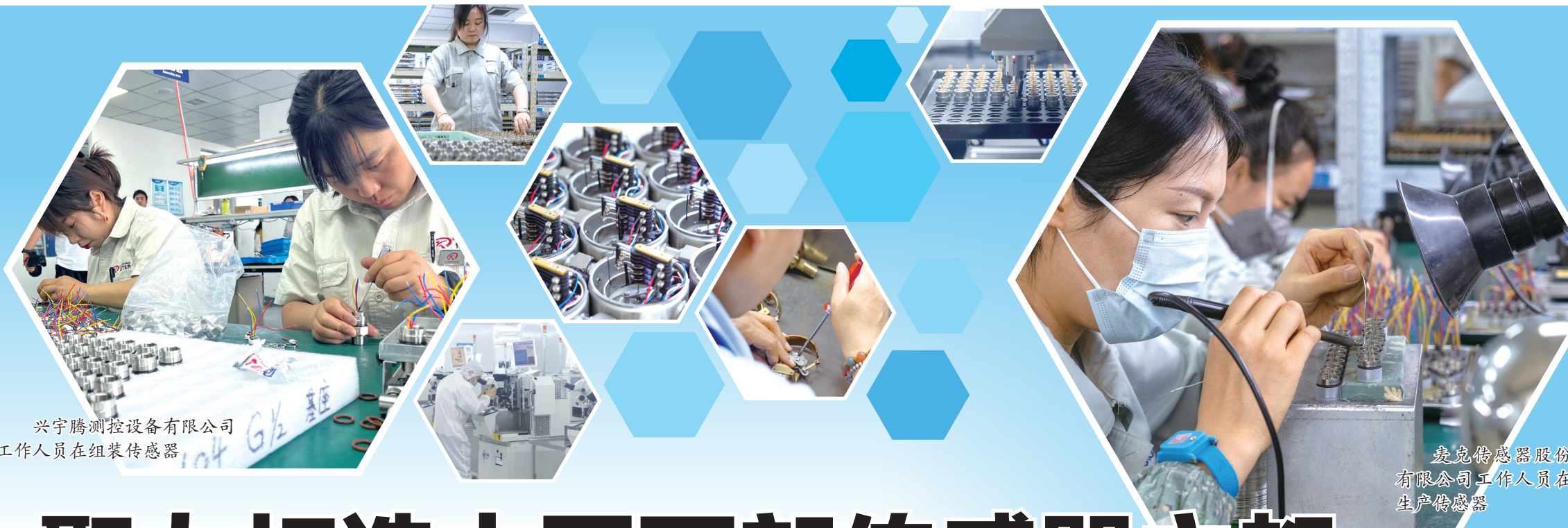
兴宇测控设备有限公司 工作人员在组装传感器