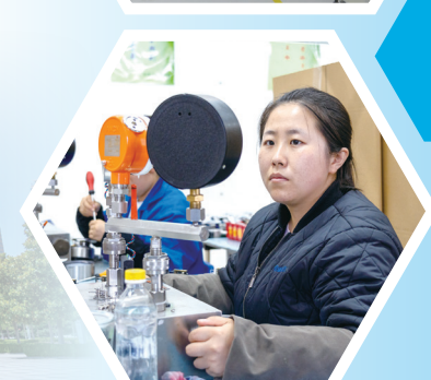
秦川机床集团宝 鸡仪表有限公司工作 人员在检测产品