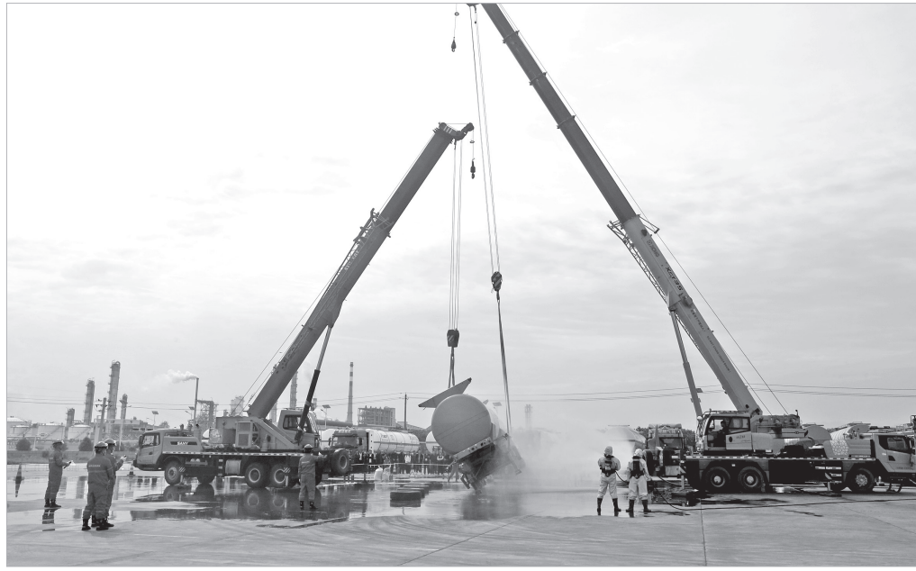
油罐车侧翻事故处置实战演练现场

与会人员在观摩、培训和经验交流中,进一步提升了道路运输企业管理水平,强化了企业安全管理能力建设,并形成了互相学习、示范借鉴、共同提高安全管理的氛围。