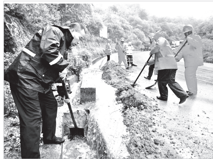
市公路局开展公路防汛工作

本报讯 进入夏季以来,我市多次出现降雨天气,市公路局立足防大汛、抢大险、抗大灾,将干线公路防汛工作落到实处。