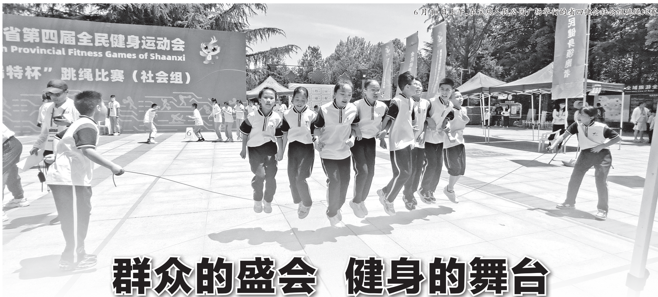
6月10日上午,在宝鸡人民公园广场举行的省四健会社会组跳绳比赛