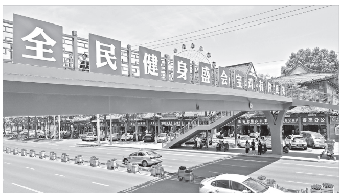
市区公园路过街天桥上醒目的宣传标语