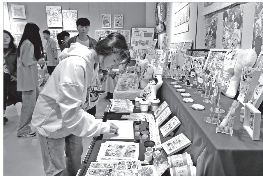
展展的年轻人在体验展品

此外，展览上的服装设计、城市景观设计、村落景观设计等也颇具时尚感，让人感受到青年创作者的新视角、新思维。这些设计作品把握图像化、信息化、时尚化的时代脉搏，通过多媒介的形式“诉说”着创作者和指导老师的创新想法，给人耳目一新、创意满满的观感。李强说：“总体来看，这些作品呈现出一种正能量，这也是我们在美术教育中强调的一个导向，那就是艺术要为人民服务、为社会文明发展服务。”