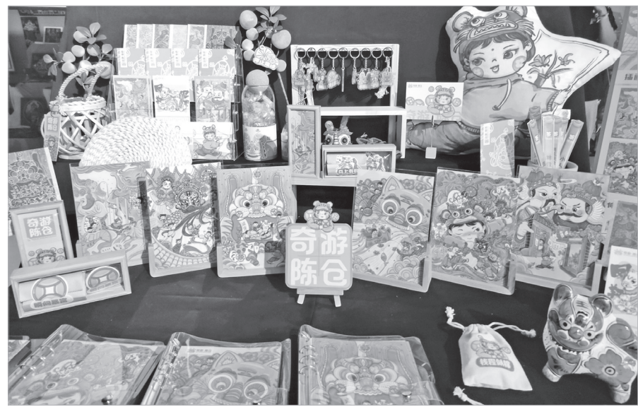
《奇游·陈仓》蕴含宝鸡非遗文化