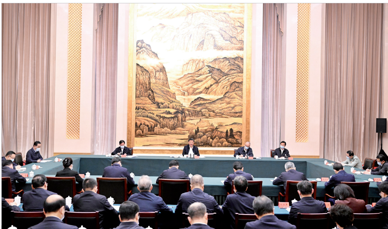
5月17日上午，中共中央总书记、国家主席、中央军委主席习近平在陕西西安主持中国—中亚峰会前夕，专门听取陕西省委和省政府工作汇报，发表了重要讲话。

新华社陕西西安/山西运城5月17日电 中共中央总书记、国家主席、中央军委主席习近平在听取陕西省委和省政府工作汇报时强调，陕西在推进中国式现代化建设中要有勇立潮头、争当时代弄潮儿的志向和魄力，奋力追赶、敢于超越，在西部地区发挥示范作用。要完整、准确、全面贯彻新发展理念，紧紧围绕高质量发展这个首要任务，着眼全国发展大局，立足陕西实际，发挥自身优势，明确主攻方向，主动融入和服务构建新发展格局，努力在实现科技自立自强、构建现代化产业体系、促进城乡区域协调发展、扩大高水平对外开放、加强生态环境保护等方面实现新突破，奋力谱写中国式现代化建设的陕西篇章。