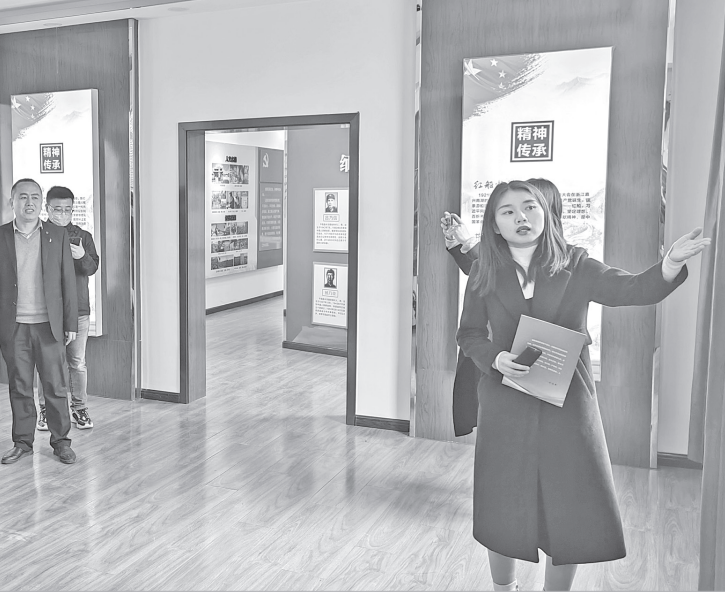
千阳县纪检监察干部到水沟镇党性教育基地开展廉政教育

常态化开展廉政教育,实现社会风气向上、向善、向廉。“我们组织编排廉政主题小品《送礼》、小戏《三打油葫芦》等优秀剧目,参加陕西省第九届小戏小品展演活动。”千阳县纪委监委相关负责同志说,创排的廉政秦腔历史剧《金麒麟》,已在全县演出10场次,清廉文化正不断融入千阳千群的生活当中。