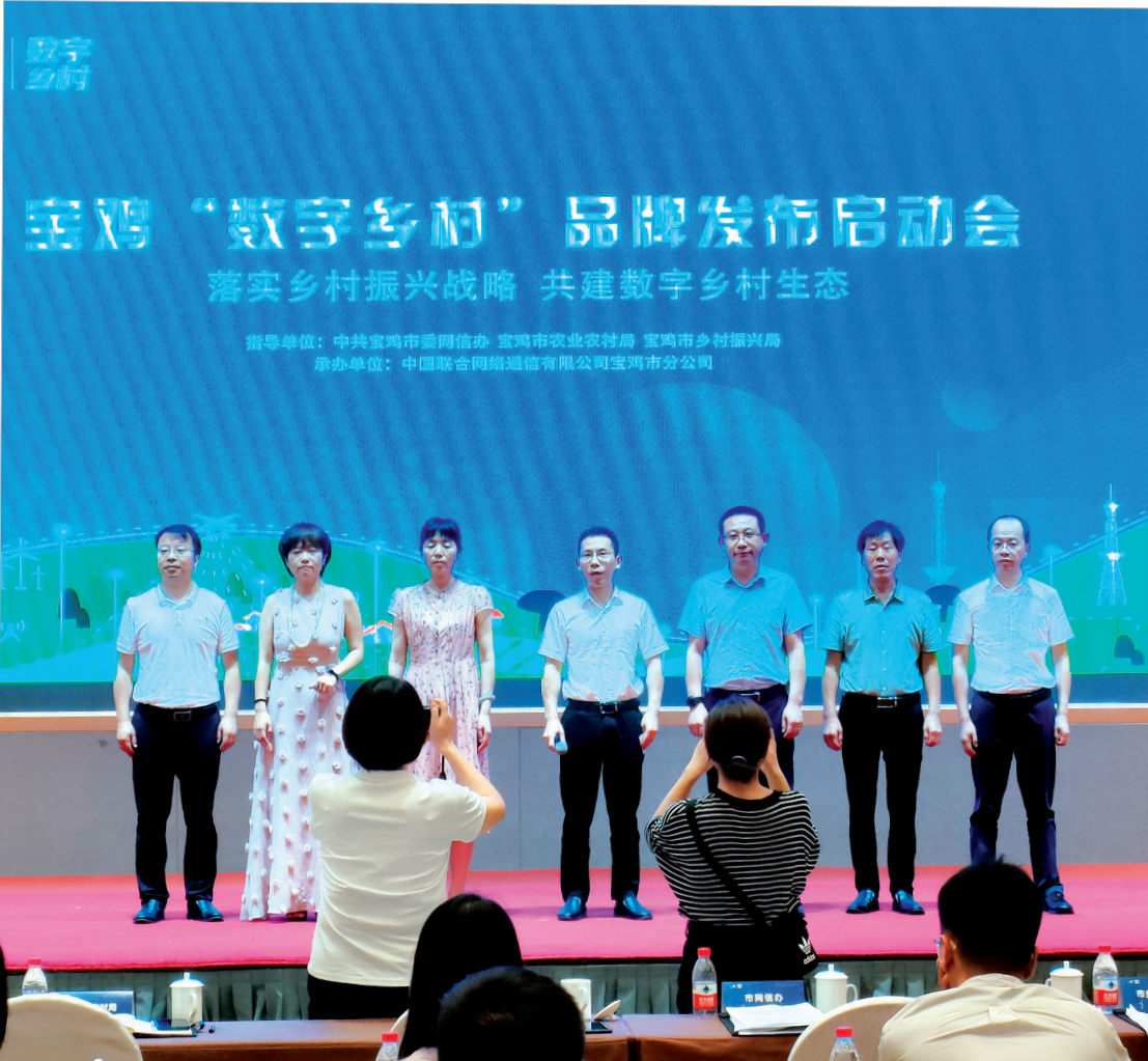
2021年7月15日举行的宝鸡“数字乡村”品牌发布启动会

宝鸡联通以数字化手段助力乡村综合治理，开发了集云网一体的“数字乡村平台”，有效地解决了村镇办公效率低、村民办事难等问题。