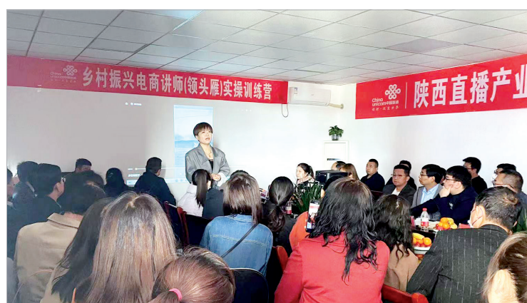
2023年3月10日“直播送培”到村组