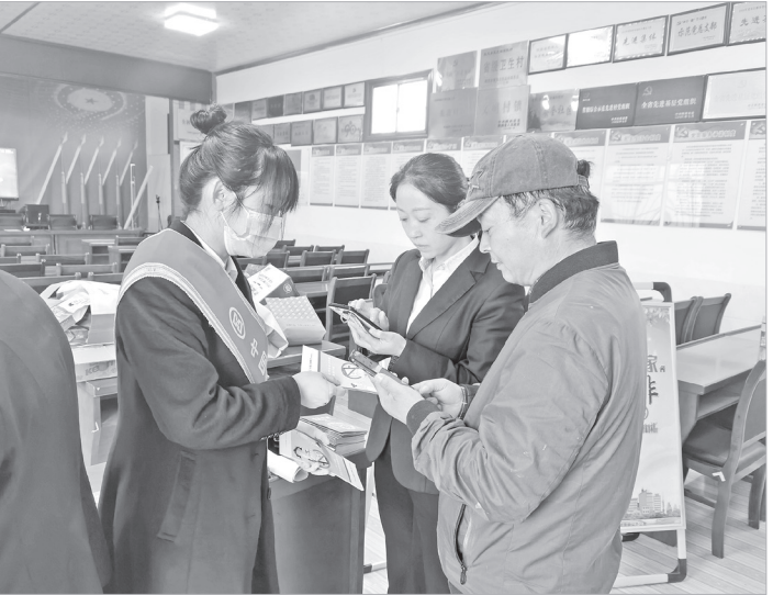
银行工作人员向群众发放防灾减灾宣传资料

近日,笔者从工行宝鸡分行了解到,连日来,该行以“防范灾害风险 护航高质量发展”为主题,开展了一系列