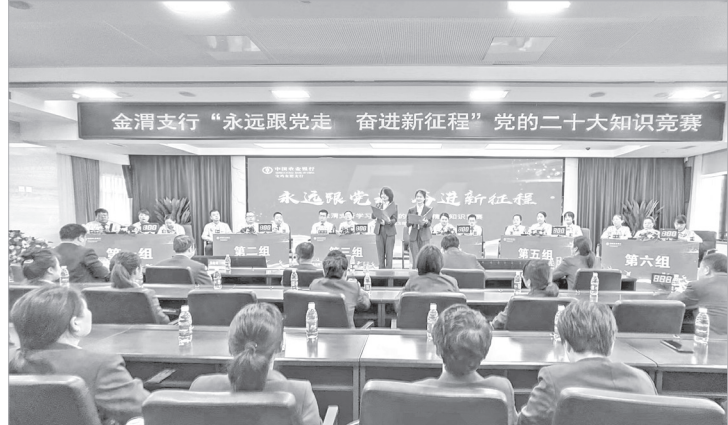
农行宝鸡金渭支行举办知识竞赛

日前,农行宝鸡分行组织辖内多个支行开展主题教育活动,进一步展现青年风采、激励青年力量,激励全行青年员工团结一心,用奋斗擦亮青春底色,以更加优异的成绩为推动农行宝鸡分行高质量发展贡献青春力量。