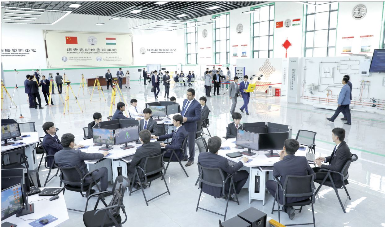
4月12日,学生们在塔吉克斯坦首都杜尚别的鲁班工坊内学习与实践。塔吉克斯坦鲁班工坊是中亚地区首家鲁班工坊。2022年3月,天津城市建设管理职业技术学院与塔吉克斯坦技术大学开始合作建设塔吉克斯坦鲁班工坊,同年11月工坊投入使用。

“近年来,中国同中亚国家关系取得长足发展,中国的发展为地区国家实现发展繁荣提供了助力。”长期关注中国同中亚国家关系的土耳其亚太研究中心主任塞