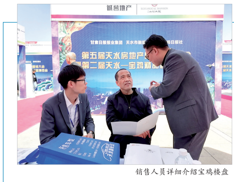
销售人员详细介绍宝鸡楼盘