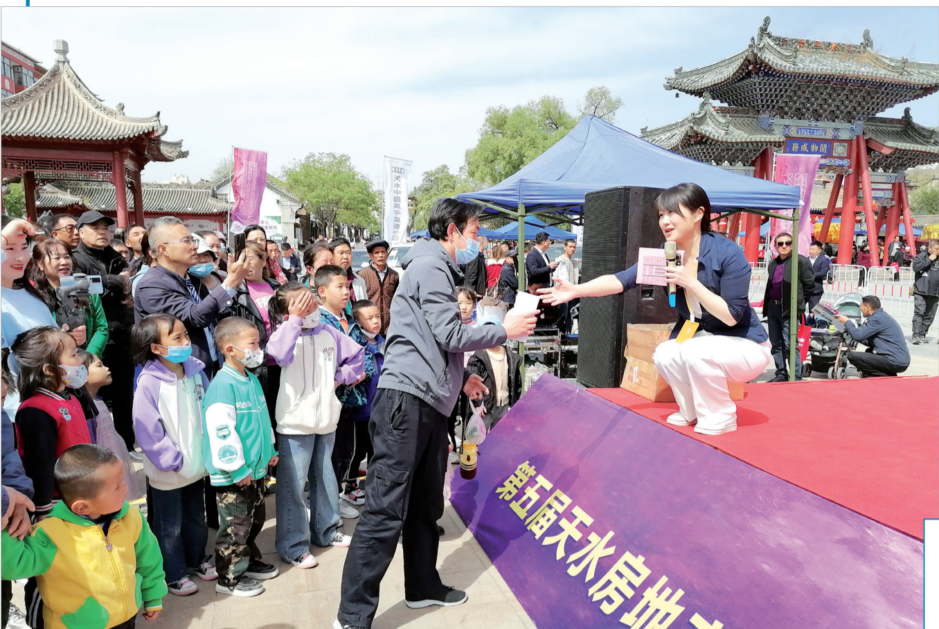
开幕式上的互动环节吸引天水市民参与