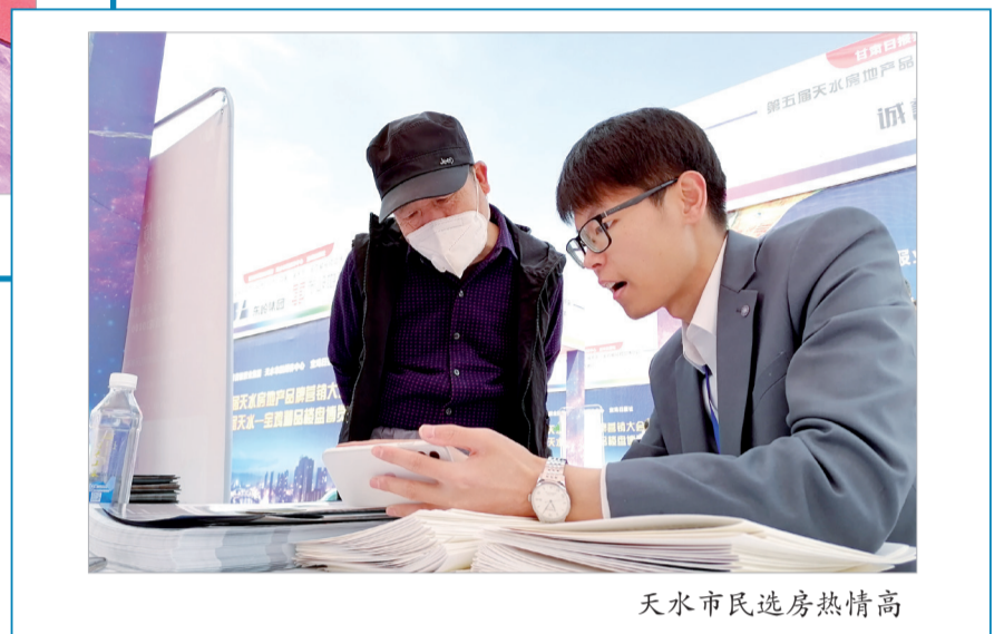
天水市民选房热情高