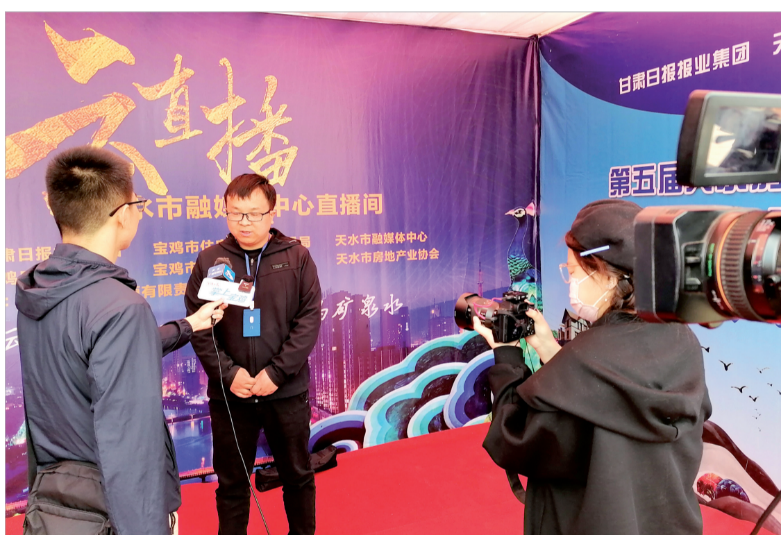
宝鸡天水两地新媒体就此次博览会进行联合采访

“宝鸡与天水地域相邻、山水相连，近年来，两市在经济、文化等领域的交流合作不断深入，《关中一天水经济区发展规划》《关中平原城市