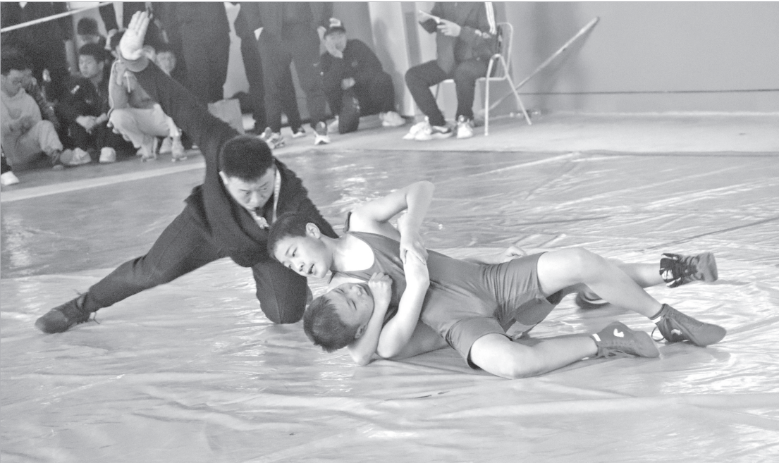
国际式摔跤比赛精彩瞬间