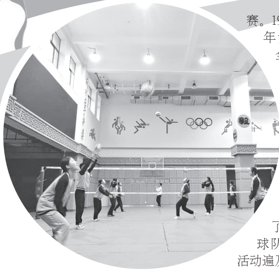
宝鸡实验小学排球队在集训