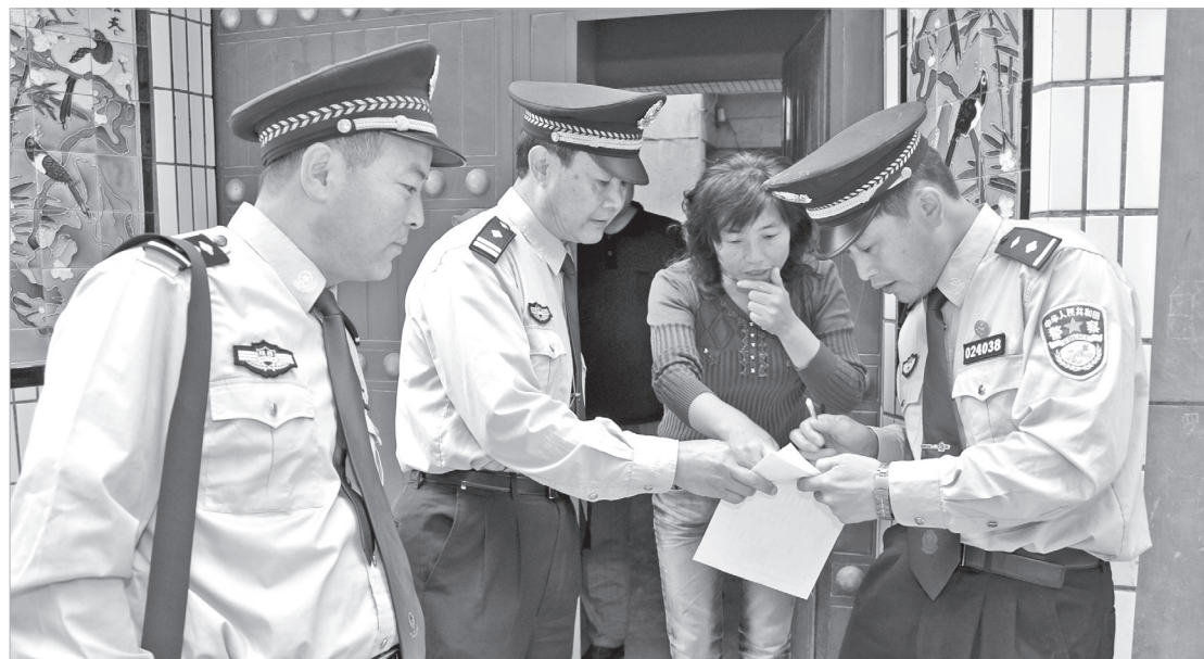
民警上门为企业员工化解矛盾纠纷

等专题内容春训,不断提高保安人员的综合素质。针对涉企违法犯罪风险,组织民警深入企业开展法治宣传、提供法律咨询,预防合同诈骗、职务侵占等违法犯罪行为的发生。同时,渭滨公安分局紧抓新媒体潮流趋势,开展特色“线上+线下”双渠道宣传。在线上新媒体账号安排专人负责,及时