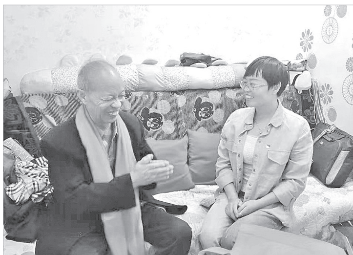
社区工作人员上门看望空巢老人

过“网格帮代办”“双报到”系统等方式，完善各类服务功能，聚焦社区“一老一幼”，累计为行动不便老人上门打扫卫生、办理高龄年