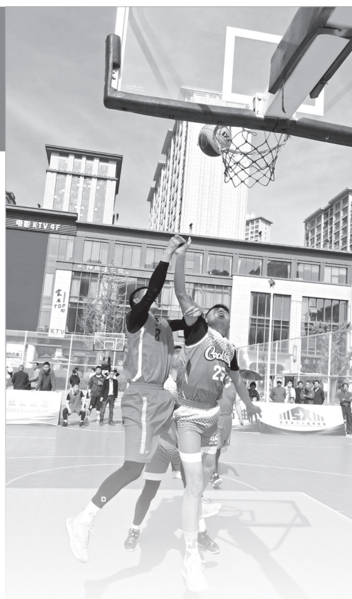
麟游县三人篮球队队员(右)在市级比赛中拼抢

“第一年我们是推广为主,各县区报的组别不一致,有的成年组别报得少,目前看,三人篮球联赛主要还是青少年参加,因为它要求