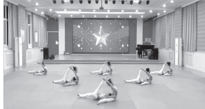
渭滨区广元路幼儿园体操队线上比赛精彩瞬间

本报讯 日前,“2022年陕西省快乐体操”大赛组委会给渭滨区广元路幼儿园颁发奖牌,嘉奖该园体操队在省赛中获得五项第一的好成绩。