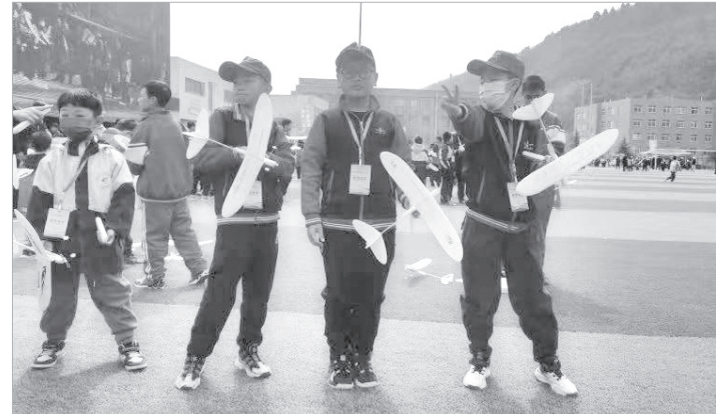
太白县青少年校外活动中心航模队队员在赛场上

本报讯(记者 孙海)日前,在铜川市举行的第二十三届“飞向北京·飞向太空”全国青少年航空航天模型教育竞赛活动总决赛(陕西赛区)中,我市太白县青少年校外活动中心航模队取得优异成绩,3人获得一等奖、2人获得二等奖、4人获得三等奖。