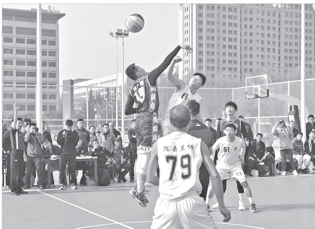
渭滨区代表队与陇县代表队较量