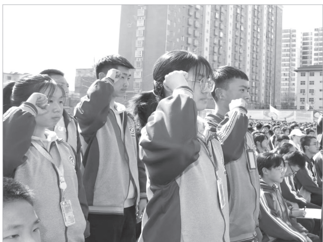
学生以青春的名义宣誓:珍惜时间,好好学习。