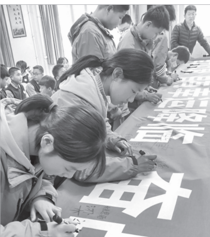
学生在横幅上写下自己的志向

类似这样的事例还有很多。连日来,我市教育人“八仙过海,各显神通”,用誓师大会+心理教育、誓师大会+感恩教育、誓师大会+励志教育、誓师大会+成人礼等形式,助力我市中考考生、高考考生以积极乐观的心态,拼搏向上的良好精神风貌,迎战人生的第一次大考。