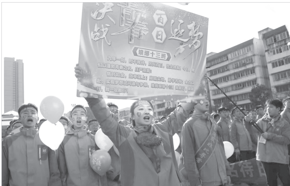
学生手举个性标语,给自己和同学加油打气。

气球、红旗、绶带、倒计时牌……日前,在宝鸡一中的中考誓师大会上,一位教师指着这些说:“这是我们誓师大会+心理教育的秘密武器,特别是这个倒计时牌,你站远一些看,它整体像不像一个‘赢’字,倒计时牌右下方像不像拳