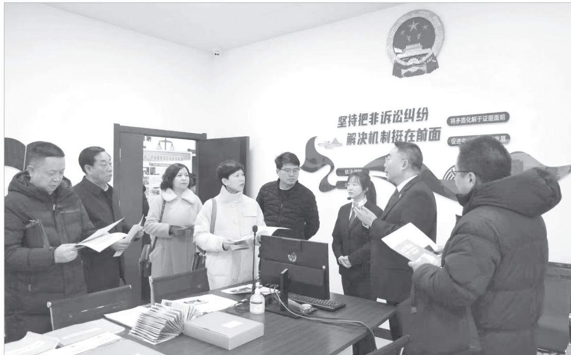
企业家代表参观金台区法院“1235”机制工作站

近年来,金台区法院受理的商事案件大幅增加,不仅加重了法院审判强度,一定程度上也增加了当事人的诉讼时间成本。“1235”工作机制,搭建成立“中国中小企业协会调解中心驻金台法院工作站”和“商会+法官”调解工作室“两个平台”加强横向协作。其中,中国中小企业协会调解中心驻金台法院工作站,采用“行业调解+司法确认”模式,将企业之间的矛盾纠纷在进入诉讼程序前导入行业调解组织,最终得以“零”诉讼费化解,极大地缩短了纠纷处理周