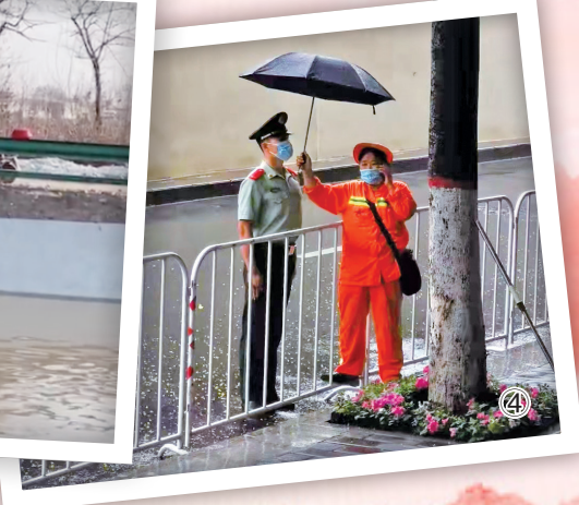
(以上照片均为资料图)